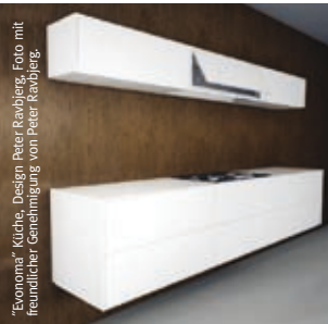
„Eurosims“ Küche, Design Peter Behring

Mit dem Namen DuPont können sie Qualität, Zuverlässigkeit und Kundenorientierung verbinden. Dies endet nicht mit dem Verkauf der Ware. DuPont verfügt über ein ausgedehntes Netzwerk gut ausgebildeter und erfahrener Verarbeiter. Damit stellen wir sicher, dass die Installationen in ausgezeichnetem Zustand den Endkunden erreichen und ihre Funktion zu vollster Zufriedenheit erfüllen werden. Dies gilt für kommerzielle und private Anwendungen gleichermaßen.